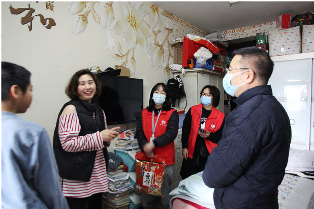
公司党委开展“温情满公寓，此心安处是我家”主题党日活动。慰问组成员向留温员工送上精心准备的慰问品并送上节日最真挚的祝福。